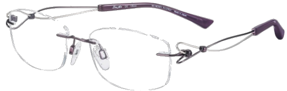
Dolce XL 2063 - PU