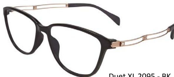
Duet XL 2095 - BK

Pentru monturile XL 2094 și XL2095, armonia desăvârșită dintre formă și funcție dă naștere unui duet completat cu accente strălucitoare. Contrastul dintre frontal și brațe este preluat pe zona temporală, unde cristale Swarovski tăiate în formă rectangulară punctează traseul celor două profile filiforme specifice liniei Duet. Aspectul sculptural al anourilor din nylon conferă purtătoarei o atitudine bine definită, punând în valoare o personalitate asumată. Dimensiunea generoasă a anoului permite insertul unor corecții multifocale, extinzând adresabilitatea în segmentul clientelor cu vârste peste 40 de ani. Modelele sunt disponibile în patru versiuni cromatice – XL2094 maro, gri, roșu, violet, iar XL 2095 negru, bleumarin, purpuriu, gri deschis - toate declinațiile având brațe asortate cu anoul pe baza principiului stilistic ton sur ton.