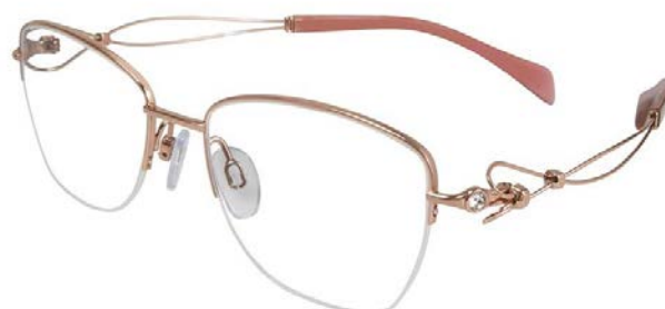
Duet XL 2097 – Rose Gold