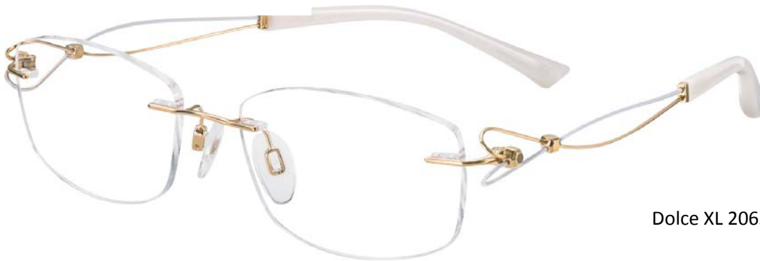
Dolce XL 2063 - GP

Modelul LineArt Charmant Dolce face aluzie la muzicalitatea feminină – inima este centrul inteligenței emoționale. Brațele sinuoase din Excellence Titan rămân în continuare centrul de interes al întregii monturi, forma lor atrăgând atenția asupra stilului său suav și romantic în care susțin discursul compozițional.