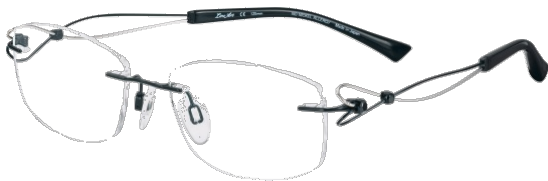
Dolce XL 2063 - BK