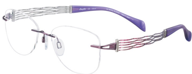
Chorus XL 2081 - RED

În mai 2016 este lansată noua generație de modele Chorus aparținând colecției LineArt Charmant. Materialul, forma și culorile încântă privirea, exprimând sincronizarea unică dintre funcționalitate, design și tehnologie. Dacă în toate versiunile anterioare predomina motivul filiform - profile de secțiune cilindrică cu diametre de 0,4-0,5 mm dispuse într-o rețea de câte două, trei, cinci sau șapte elemente, noua linie Chorus aplează la profilul lamelar. Mărirea secțiunii crește impactul vizual, efect susținut și de jocul cromatic, sistemul lamelar participând semnificativ la identificarea și diferențierea fiecărui model.