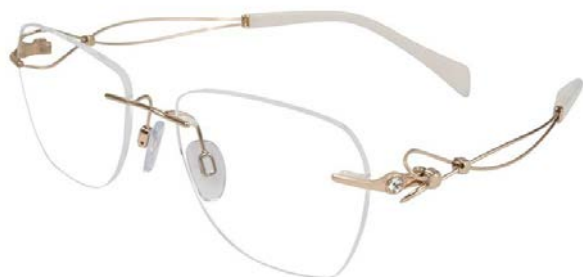
Duet XL 2096 – Gold White

Monturile XL2096 și XL2097 aparțin liniei Dolce, rezolvarea în formă de inimă a articulației brațului fiind o aluzie la organul inteligenței emoționale. Brațele din Excellence Titan rămân în continuare centrul de interes al întregii monturi, forma lor sinuoasă atrăgând atenția asupra stilului suav și romantic al discursului compozițional cu adresabilitate feminină. Confortul instant este o trăsătură definitorie pentru orice montură LineArt. Pe lângă extraordinara flexibilitate a brațelor, un element distinct îl constituie adaptarea dinamică a perniițelor nazale. Adaptive nose pads reacționează la temperatura corpului, permițând perniițelor să-și schimbe treptat forma, preluând curbura nasului. După o anumită perioadă de timp (în mod normal, de la 14 zile până la 1 lună), această trăsătură dispare treptat, iar suportul metalic menține ulterior forma adaptată. Sistemul perniițelor adaptive dispersează unitar presiunea monturii asupra nasului și oferă o utilizare stabilă și confortabilă.