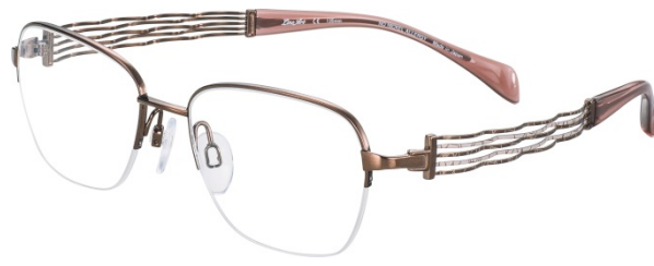
Chorus XL 2081 - RED