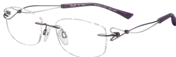
Dolce XL 2063 - PU