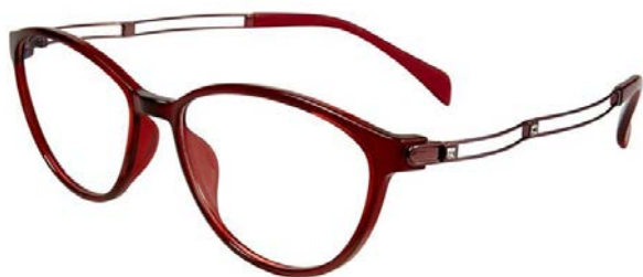
Duet XL 2094 - RED