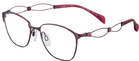
Sonata XL 2103 - RE

Identitatea vizuală Sonata este perfect exprimată de rezolvarea stilistică a brațelor – silueta tridimensională se remarcă prin jocul celor două segmente curbate în care sunt incluse două tije filiforme armonios asamblate. Piesele de legătură hexagonale dispuse la nodurile rețelei adaugă o notă de lux, accentele de culoare punctând pasiunea pentru detalii alese în acord cu natura premium a colecției LineArt Charmant. Imaginea ușor arcuită, aspectul delicat și rafinat, se asortează perfect cu monturile feminine, transformând Sonata într-o poezie vizuală ce urmează linia melodică a unei veritabile sonate clasice: primo tempo – introducere vioaie, secondo tempo – temă cu variațiuni și terzo tempo – allegro sau presto.