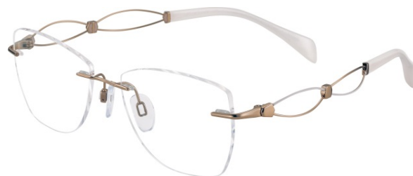
Sonata XL 2104 - GP