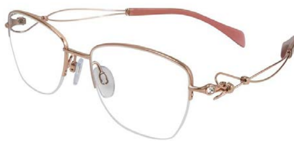
Duet XL 2097 – Rose Gold