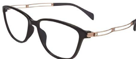
Duet XL 2095 - BK

Pentru monturile XL 2094 și XL2095, armonia desăvârșită dintre formă și funcție dă naștere unui duet completat cu accente strălucitoare. Contrastul dintre frontal și brațe este preluat pe zona temporală, unde cristale Swarovski tăiate în formă rectangulară punctează traseul celor două profile filiforme specifice liniei Duet. Aspectul sculptural al anourilor din nylon conferă purtătoarei o atitudine bine definită, punând în valoare o personalitate asumată. Dimensiunea generoasă a anoului permite insertul unor corecții multifocale, extinzând adresabilitatea în segmentul clientelor cu vârste peste 40 de ani. Modelele sunt disponibile în patru versiuni cromatice – XL2094 maro, gri, rosu, violet, iar XL 2095 negru, bleumarin, purpuriu, gri deschis - toate declinațiile având brațe asortate cu anoul pe baza principiului stilistic ton sur ton.