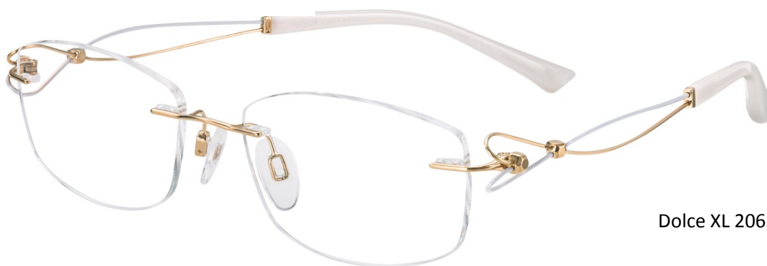
Dolce XL 2063 - GP

Modelul LineArt Charmant Dolce face aluzie la muzicalitatea feminină – inima este centrul inteligenței emoționale. Brațele sinuoase din Excellence Titan rămân în continuare centrul de interes al întregii monturi, forma lor atrăgând atenția asupra stilului suav și romantic în care susțin discursul compozițional.