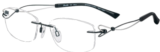
Dolce XL 2063 - BK